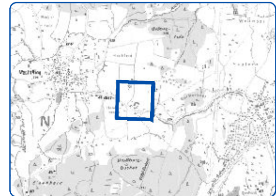
Übersichtskarte - Maßstab i.O. 1:50000

Schutzgebiets- und Übersichtskarte zur 32. Verordnung zur Änderung der Landschaftsschutzverordnung "Westlicher Teil des Landkreises Starnberg" des Landkreises Starnberg vom für den Bebauungsplan Nr. 60 IWL Machtlfing in der Gemarkung Machtlfing, Gemeinde Andechs