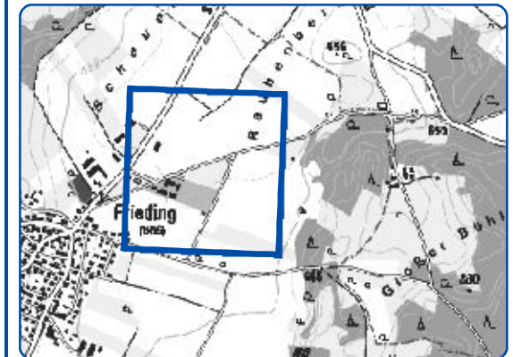
Übersichtskarte - Maßstab i.O. 1:25000

Schutzgebiets- und Übersichtskarte zur 31. Verordnung zur Änderung der Landschaftsschutzverordnung "Westlicher Teil des Landkreises Starnberg" des Landkreises Starnberg vom für den Bebauungsplan Frieding Nord Teilbereich Strobl in der Gemarkung Frieding, Gemeinde Andechs