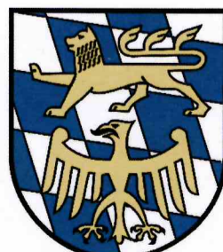
Landrat des Landkreises Starnberg Landrat Stefan Frey