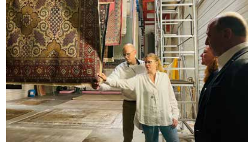
Einblick in den Trockenturm